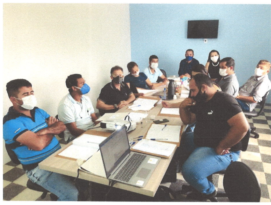
Figuras 1 e 2. Consultoria para construção do planejamento estratégico no dia 13/07/2021.