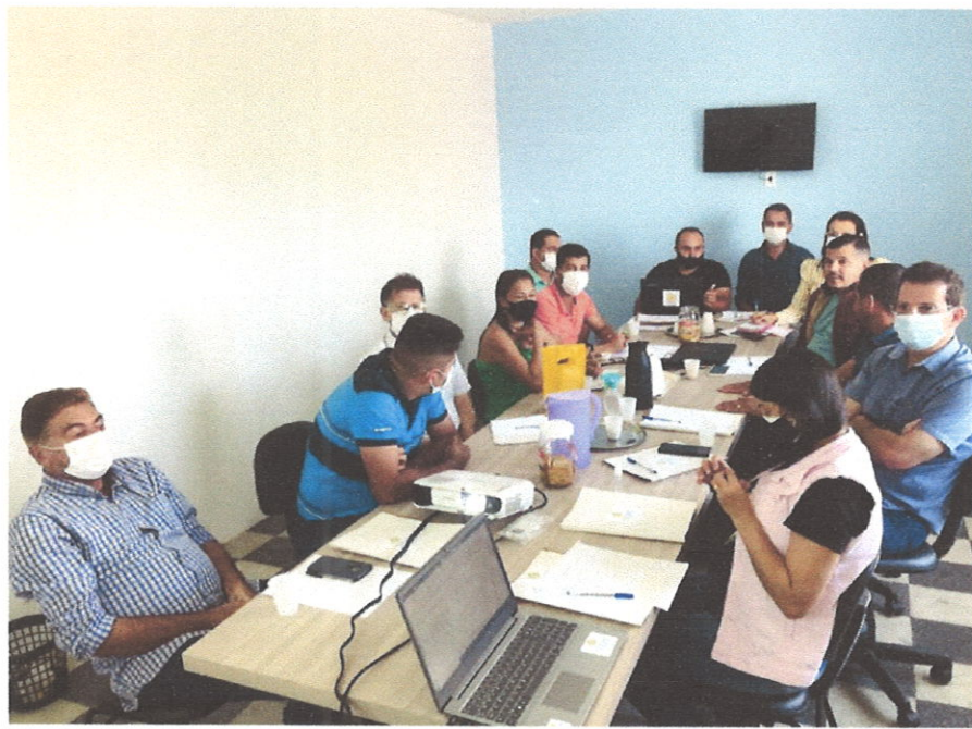
Figuras 3 e 4. Consultoria para construção do planejamento estratégico no dia 15/07/2021.