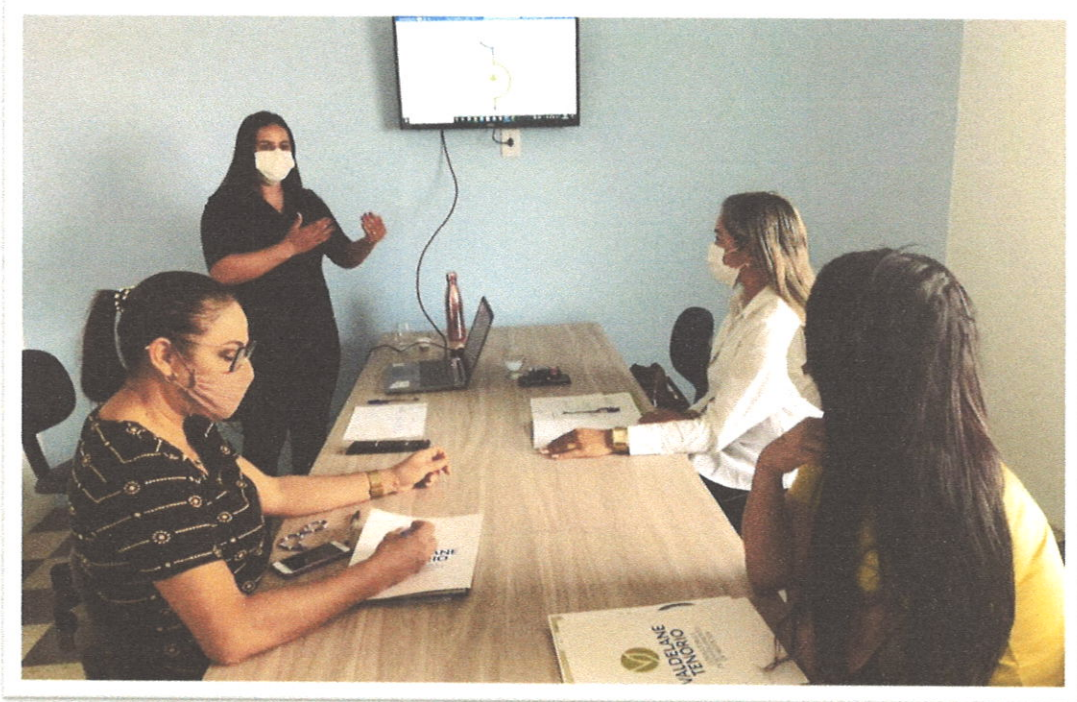
Figuras. Registro da consultoria para construção do planejamento estratégico realizada no dia 09/09/2021.