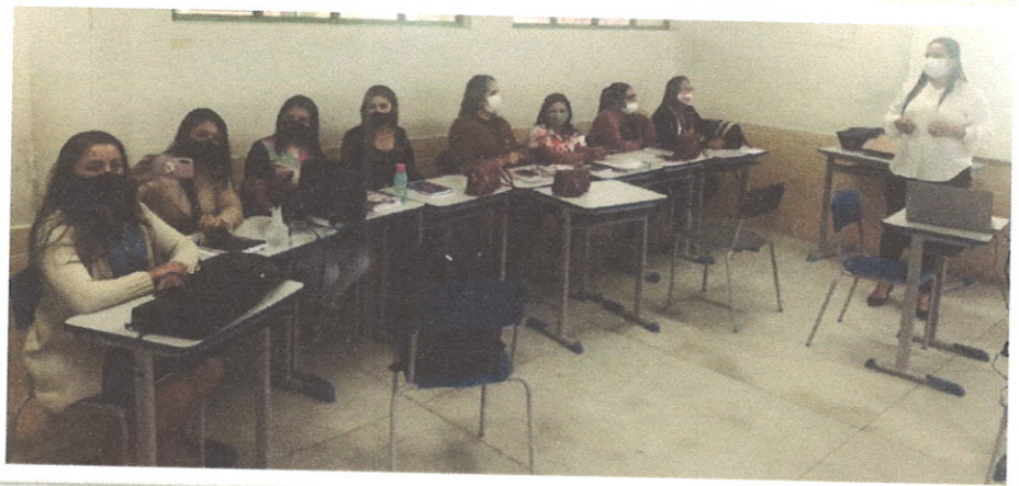
Figura 9. Consultoria para construção do planejamento estratégico.