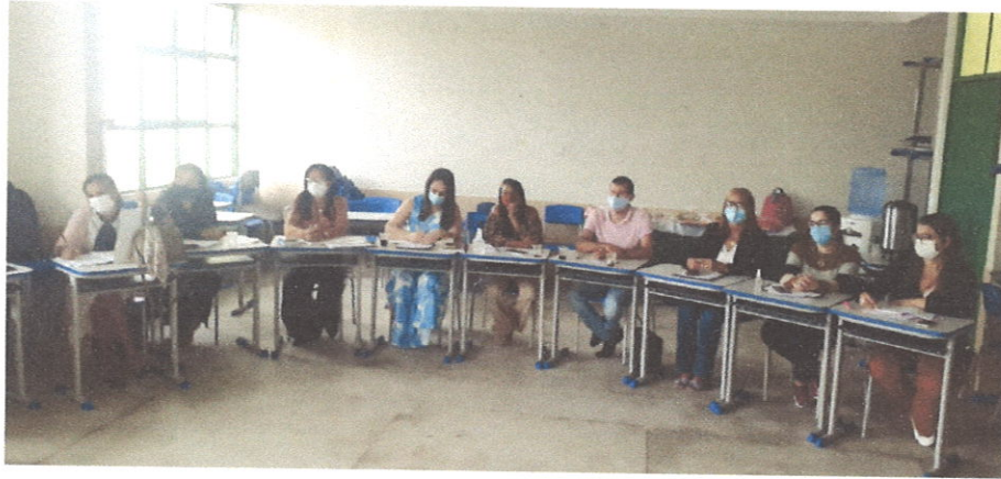
Figura 4. Consultoria para construção do planejamento estratégico.

CONSULTORIA E DESENVOLVIMENTO DE NEGÓCIOS