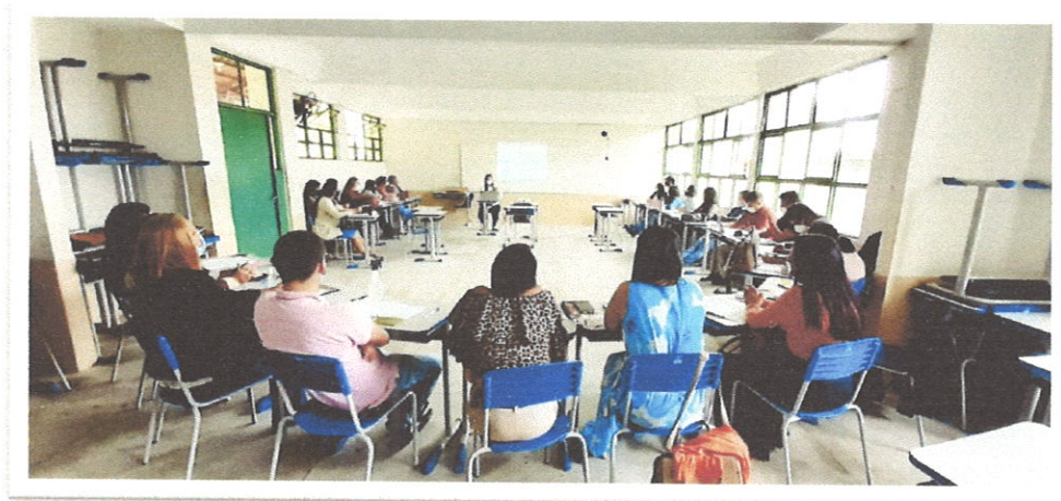
Figura 1. Consultoria para construção do planejamento estratégico.