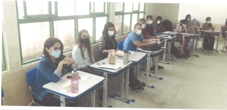
Figura 7. Consultoria para construção do planejamento estratégico.

CONSULTORIA E DESENVOLVIMENTO DE NEGÓCIOS