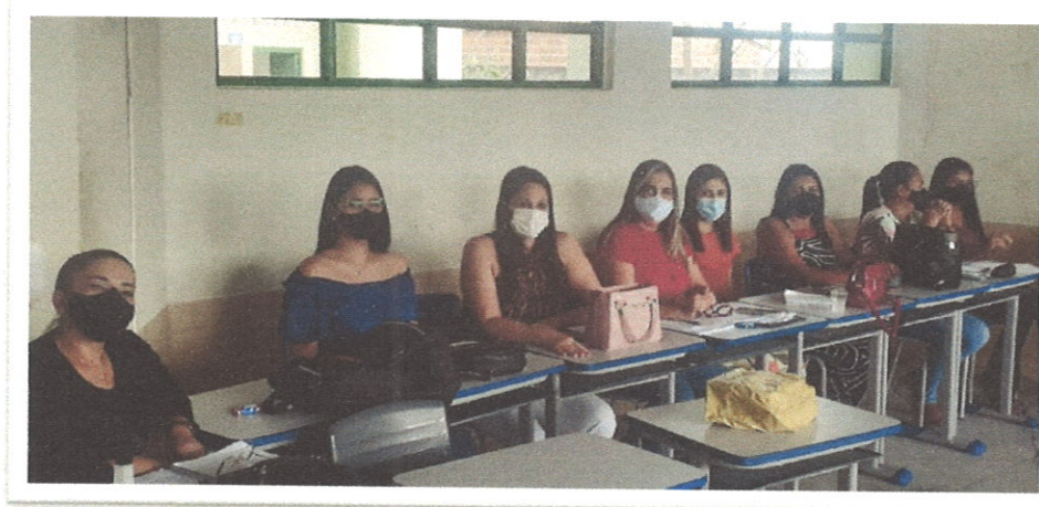
Figura 2. Consultoria para construção do planejamento estratégico.