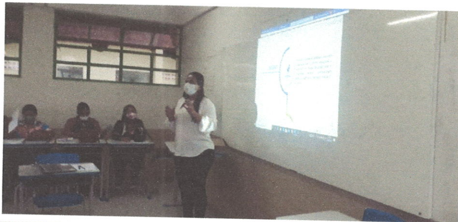
Figura 8. Consultoria para construção do planejamento estratégico.