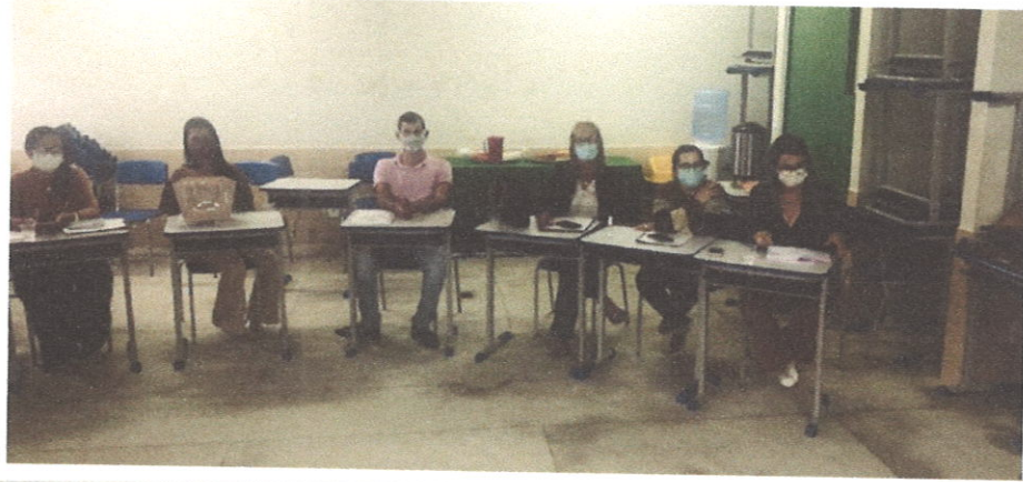
Figura 10. Consultoria para construção do planejamento estratégico.

CONSULTORIA E DESENVOLVIMENTO DE NEGÓCIOS