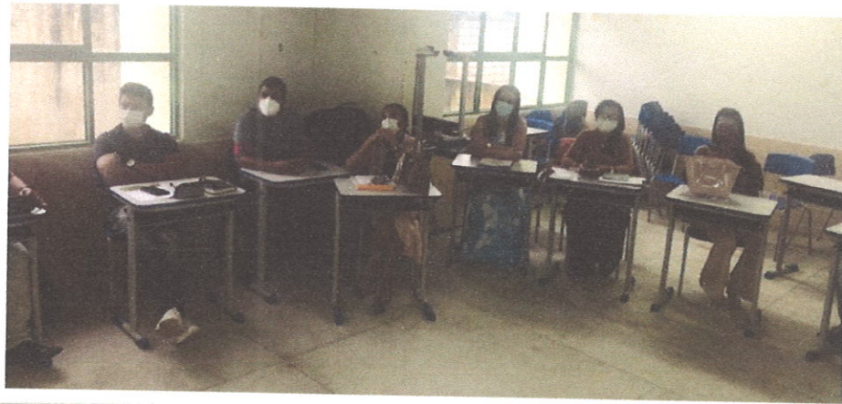
Figura 11. Consultoria para construção do planejamento estratégico.