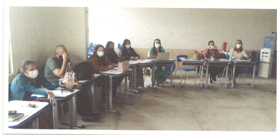
Figura 3. Consultoria para construção do planejamento estratégico.