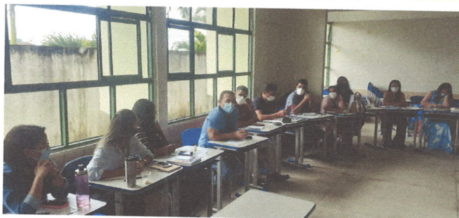
Figura 6. Consultoria para construção do planejamento estratégico.